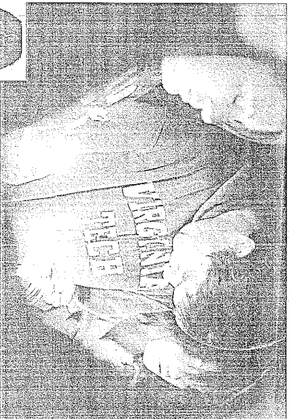
EN LA UNIVERSIDAD Virginia Tech, una treintena de estudiantes y profesores murieron cuando un joven surcoreano de 23 años abrió fuego contra ellos.

Este fenómeno acaparó la atención pública nuevamente tras la masacre